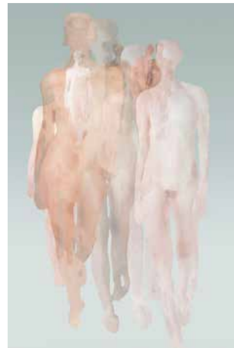
Serie: 'The Nudes'