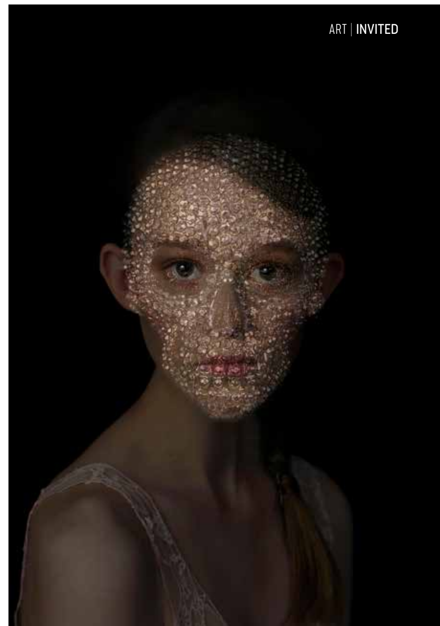
Ode To Damien

Wat was je meest recente ontmoeting met iemand die jou raakte? “Meestal vind ik mijn modellen zelf, maar soms komt ook iemand naar mij toe. Zo heb ik een meisje ontmoet in Soho House Amsterdam, dat daar een lezing van mij had bijgewoond over The Art of Love . Ze was al eerder gefotografeerd door de meest waanzinnige fotografen en leek het leuk om met mij te werken. Een week later was ik bij een gieterij om voorwerk te doen voor de beeldhouwkunst – ik wil heel graag van twee- naar driedimensionaal in mijn werk. In die